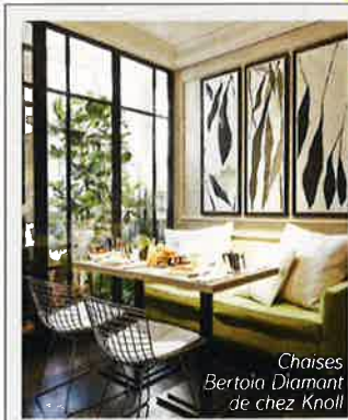
Chaises Bertora Diamant de chez Knoll