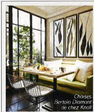
Chaises Bertora Diamant de chez Knoll