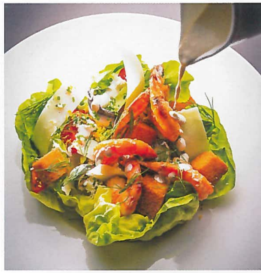
右 / 苺のサヴァラン Précieux savarin aux fraises €14上 / 海の幸のシーザーサラダ €13